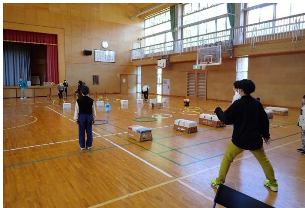
↑「だるまさんのいろいろな1日」

縦割りごとに分かれてお店の内容を考え、準備しました。準備では、高学年がリーダーシップを発揮し、作業を進めていました。みどりっ子まつり当日では、前後半に分かれてお店を運営しました。仕事を分担し、力を合わせて行っていました。どの班も工夫した内容で楽しいものばかりでした。