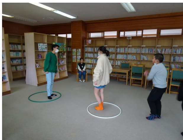
↑「ジェスチャーゲーム」