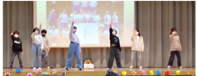
↑ 3年生の出し物の様子