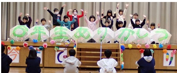
↑ 1年生の出し物の様子

これまで朝日みどり小学校を立派にリードしてきた6年生に、1～5年生が感謝の気持ちを伝えました。5年生が中心となって全校をまとめ、6年生のために様々な準備を行い、すばらしい会となりました。