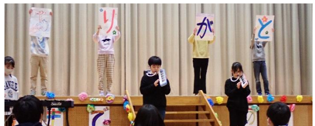
↑ 5年生の出し物の様子