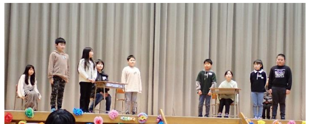
↑ 4年生の出し物の様子