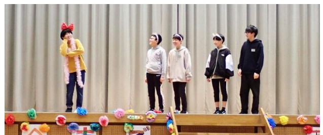
↑ 6年生の出し物の様子