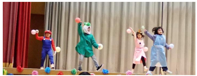
↑ 2年生の出し物の様子