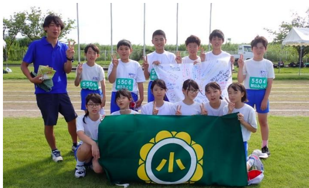
↑ 6年生全員で集合写真