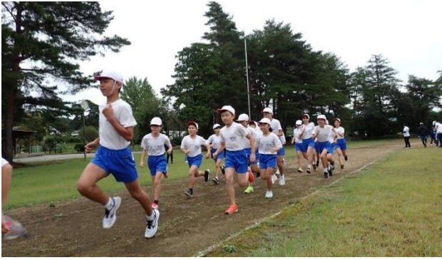
↑ 高学年のスタートの様子です。