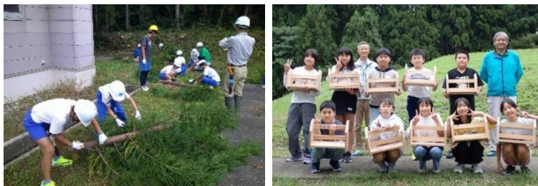
↑ 6年生の枝打ち ↑ 5年 集合写真

新潟県北部地域林業振興協議会の方々より、森林教室を行っていただきました。6年生は枝打ち体験、5年生は本立て作りを行いました。貴重な体験をさせていただきありがとうございました。