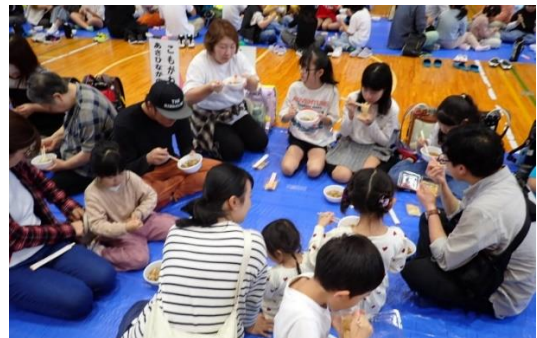
↑ もちふるまいの様子です。