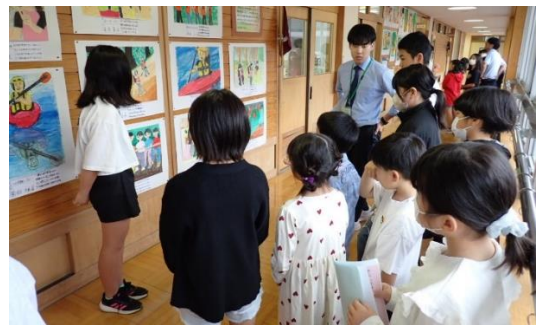
↑ 絵画作品の紹介場面です。

たかねまちづくり協議会主催のもちふるまいでは、きなこもち、とちもち（あんこ）、お雑煮をご馳走になりました。子どもたちは、「おいしい。」と喜んでいました。ありがとうございました。