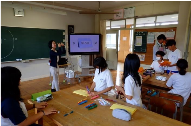
↑ 授業体験の様子です。

朝日中学校で入学体験を朝日地区3校の6年生で行ってきました。中学校の先生による授業体験と部活動体験をしました。中学校生活のイメージがもてたと思います。