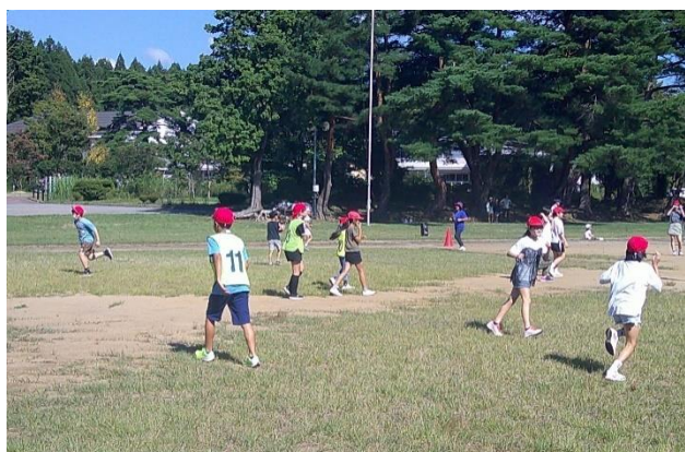
↑ 鬼ごっこの様子です。

保健運動委員会主催で、全校鬼ごっこが行われました。初めに各学年から選ばれた児童が鬼になり、増え鬼を行いました。グラウンドいっぱい広がって全校で走り回りました。よい天気の中、全校で楽しむことができました。