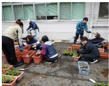
↑ 窓ふきと花植え作業の様子です。