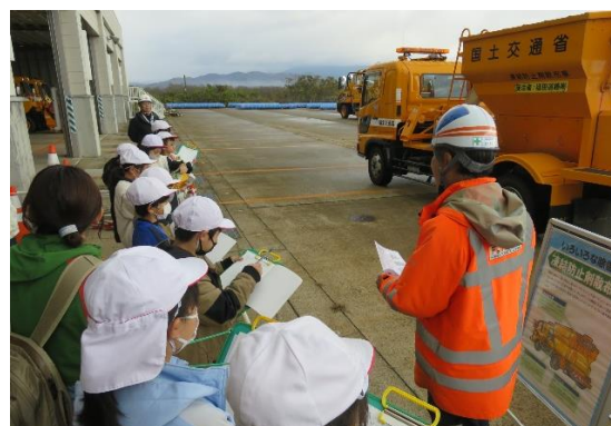
↑ 1台1台丁寧に教えていただきました。

3・4年生が、福田道路朝日支店様より朝日除雪ステーションにて除雪作業体験学習を行っていただきました。除雪機械のデモンストレーションを見せていただきながら、それぞれの除雪機械の説明を丁寧にさせていただきました。また、実際に除雪機械の運転席に乗せていただきました。ありがとうございました。