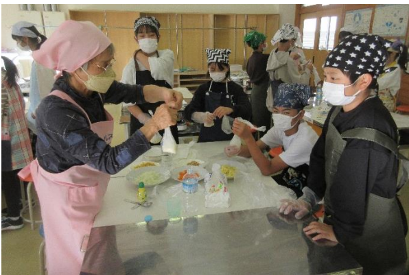
↑ 作業の手順を学んでいる様子です。

村上市食生活改善推進委員協議会の皆様をお招きして、災害に役立つ「パッキング（ポリ袋に食材を入れて湯せんで火を通す調理法）」を体験しました。電気、ガス、水道などのライフラインが使用できない状況下での食事作りを学びました。できたツナじゃがをみんなでおいしくいただきました。