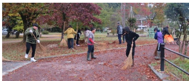
↑ 子どもたちも頑張りました。