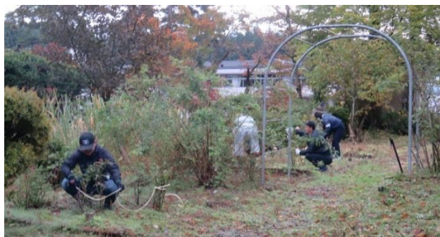
↑ バラ園の冬囲いの様子です。

PTA広報環境整備部主催によるPTA校内美化作業・冬囲い作業が行われました。参加していただいた区長様や保護者の皆様からは、冬囲い作業と窓ふき作業等をしていただきました。手際よく多くの箇所の作業をしていただきました。また、普段の清掃では、できないところまできれいにしてくださいました。ありがとうございました。