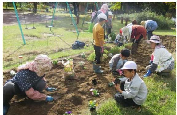
↑ 一緒に花を植えました。

たかねまちづくり協議会や地域コーディネーター様から前庭の花壇の整備をしていただき、花の苗を植えていただきました。お昼休みの時間帯が苗植えのタイミングと重なり、興味のある子どもたちが飛び入り参加をしました。これからの花壇の様子が楽しみです。