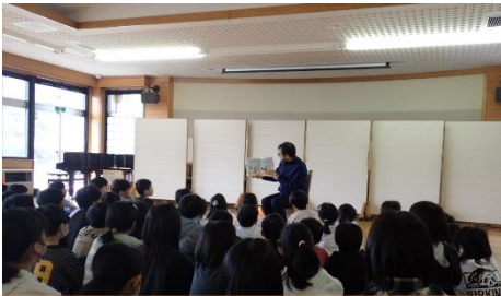
全校読み聞かせで真剣に耳を傾ける姿

わが子に本を好きになってほしいと願うご家庭は多いのではないのでしょうか。本の主人公のように、優しい心や素直な心、そして困難に向き合う強い心を育ててほしいという思いがあるからだと思います。また、本を通してさまざまな知識に触れ、考える力が育つことへの期待もあるでしょう。